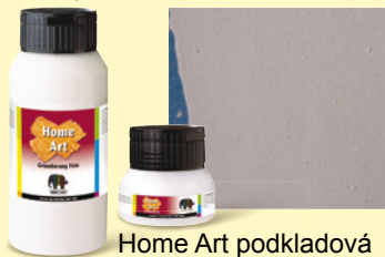
Home Art podkladová barva hrubá 002

Home Art jsou dekorativní lazurní barvy, které obsahují efektní prvky. Nanášení plochým štětcem je velmi snadné a po zaschnutí vyniknou efektní malé částice. Díky univerzální přilnavosti podkladové barvy na různé povrchy můžete dekorovat nábytek, ozdobnou keramiku, interiéry nebo lze malovat na maližské plátno, karton, dřevo, terakotu, květináče, kámen, umělé hmoty (kromě polyethylenu). Home Art lze kombinovat a využít v dalších výtvarných a dekorativních technikách, jako např. découpage – ubrouskové technice společně s akrylovými barvami Hobby Acryl matt.