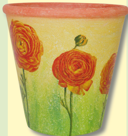
Návrh, realizace, layout Lucie Faltýnková V/2008

Naneste Home Art podkladovou barvu. Suchý podklad přetřete lazurami. Ne zcela zaschlé lazury „uhladte“ suchým širokým štětcem. Po zaschnutí nalepte lepidlem motivy květů z ubrousku. Květináč pak dobře přetřete ( i několikrát ) čirým lakem a to i zevnitř včetně odtokové díry tak, aby se k terakotě nedostala voda.