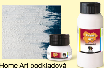
Home Art podkladová barva jemná 001

Pro přípravu pevných povrchů před nátěrem lazurou Home Art. Barva obsahuje jemný písek, je bílá, lze tónovat barvami Hobby Acryl matt.